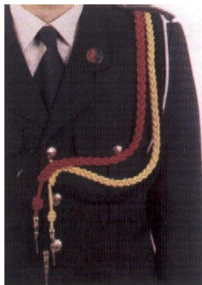
MP's in dienst in het Paleis der Natie