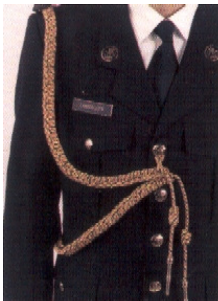
Defensieattachés Adjuncten van de defensieattachés Vleugeladjudanten van generaals