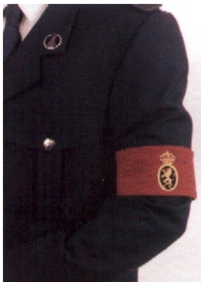
Officier vertegenwoordiger van de Minister van Landsverdediging